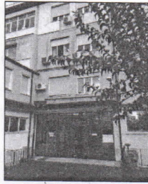
L'entrata dello "Jazzolino"

Tra le difficoltà maggiormente incontrate «vi sono i problemi organizzativi, che implicano un carico di lavoro troppo alto, difficoltà nella gestione dei turni a causa della carenza di personale, problemi di ferie e, soprattutto, la sensazione di non riuscire a portare a termine il lavoro con l'attenzione e la disponibilità auspicuate». Bisogna, in tal senso, cambiare approccio: «In quanti hanno mai ringraziato un medico o un infermiere per il proprio lavoro? Rispondereste "ma tanto è il suo mestiere". In realtà, dovremmo